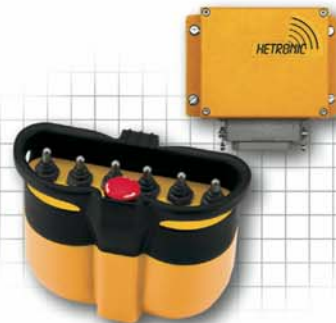
Standard Nova-S mit passendem Empfänger