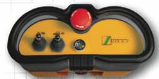
OEM Version für Mörtelpumpen

Der NOVA-S Sender in Kombination mit einem HETRONIC Empfänger versichert eine mühelose Integration des Machinenschaltkreises.