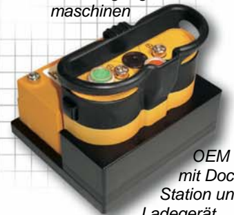
OEM Version mit Docking Station und Ladegerät