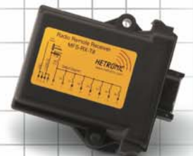
MFSHL RX-T8 Empfänger