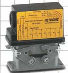
MFSHL RX-T8 Empfänger