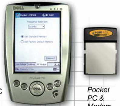
Pocket PC & Modem

Mit MFS ist eine Bedienung von bis zu 20 Sendern mit derselben Frequenz in näherer Umgebung möglich. Das heißt dass sich Bediener keine Gedanken über die Frequenzeinstellungen machen müssen.